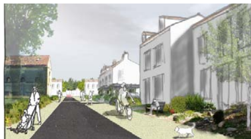
Modélisation en 3D & Perspective d'ambiance- 3A Studio