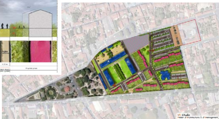
Proposition de découpage parcellaire et hypothèses bâties - 3A Studio